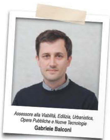
Assessore alla Viabilità, Edilizia, Urbanistica, Opere Pubbliche e Nuove Tecnologie Gabriele Balconi

L'obiettivo che ci siamo posti come Amministrazione è quello di dare risposte concrete a bisogni reali: scuole più funzionali, un territorio più sicuro, spazi pubblici a norma e una mobilità sempre più sostenibile. In queste pagine desidero condivi-